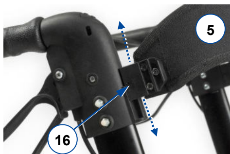
Figure 3 : insérer/retirer la ceinture de soutien dorsal

Pour la démonter, desserrez la vis et faites à nouveau coulisser la base jusqu'à ce que l'extrémité du soutien dorsal se déboîte.