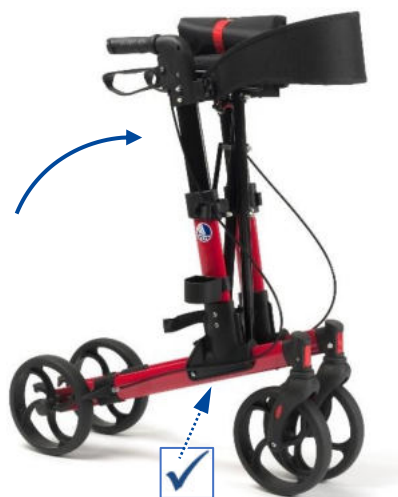
Figure 1 : déplier le rollator