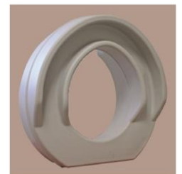
Fixation sans vis ni outils