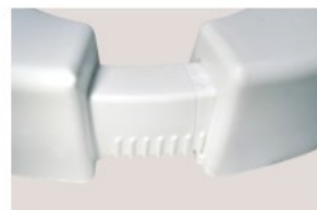
Ajustement par crantage