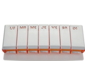
7 jours, 1 prise quotidienne