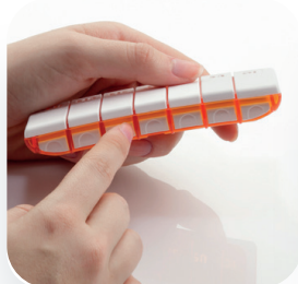
S'ouvre d'une simple pression