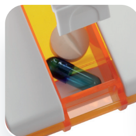
Fermeture sécurisée grâce à la barre de protection