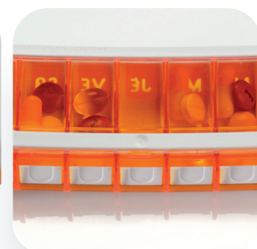
Contrôle des prises d'un simple coup d'œil