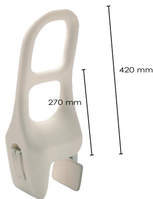
Invacare Balnéa H160 1522374

Poignée de bain pour faciliter le passage du rebord de baignoire, faciliter les mouvements à l'intérieur de celle-ci (Se relever/se baisser) Fixation très simple qui s'adapte à toutes les baignoires. (Réglable de 73 à 152 mm )