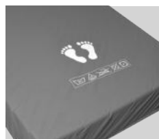
Housse PU (polyuréthane) M1