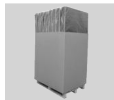
Palette standard Carton de 8 matelas par palette