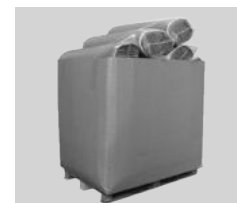
Roulé comprimé Carton de 15 matelas par palette