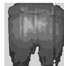
Résultat répartition des pressions

Conditionnement pour 410060 : Carton de regroupement : 8 pc. Palette : 8 pc.