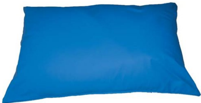
410164 micro billes 410187 fibres

fibres : fibres creuses enduites de silicone légère et souple.