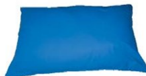
410162 micro billes 410183 fibres