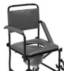
Accoudoirs et repose-pieds amovibles