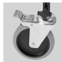
2 roues avec freins