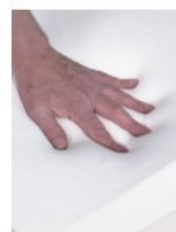
Mousse visco 86 \text{ kg/m}^3