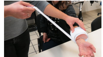
Coussin hémostatique Coupe hémo