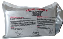
Coussin hémostatique Coupe hémo