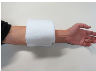
Coussin hémostatique Coupe hémo