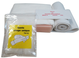
Coussin hémostatique Coupe hémo