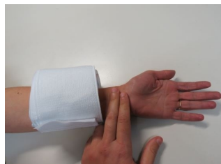
Coussin hémostatique Coupe hémo