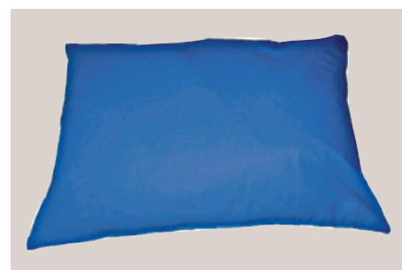
Le coussin universel