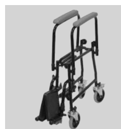
Facile à plier