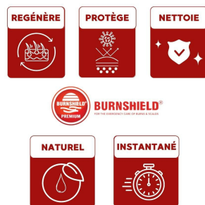
Sachet gel brulure Burnshield bénéfiques