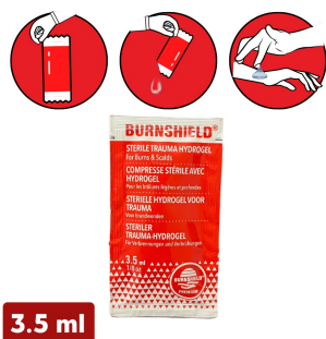
Sachet gel brulure Burnshield