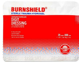
Comresse brulure Burnshield pour membre