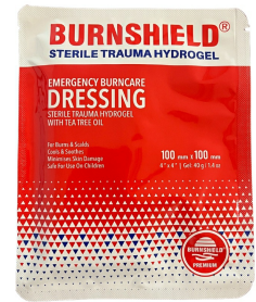
Comresse brulure Burnshield pour membre