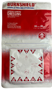
Comresse brulure Burnshield pour membre