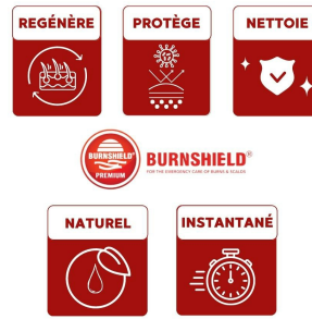
Comresse brulure Burnshield bénéfiques