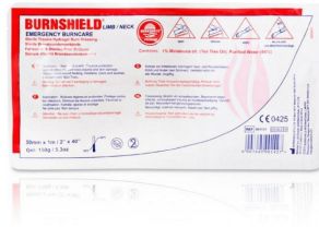
Comresse brulure Burnshield