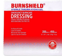
Comresse brulure Burnshield pour membre