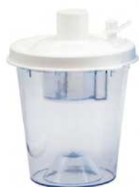
Bocal 800 ml pour patient unique (de série)