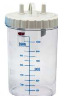
Bocal 1200 ml autoclavable