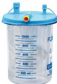
Poche jetable 1000 ml